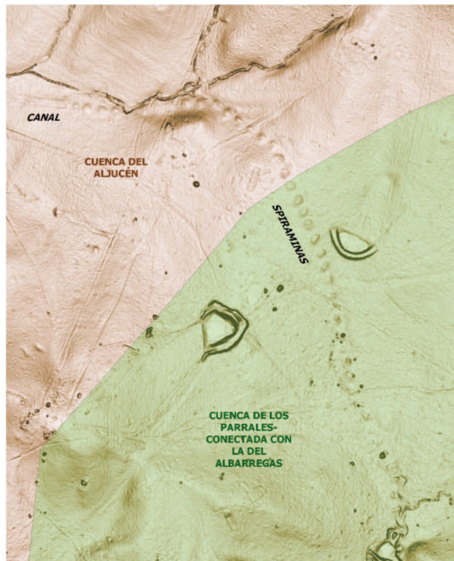
Figura 2. ALINEACIÓN DE MONTÍCULOS IDENTIFICADOS COMO SPIRAMINAS PARA CONSTRUIR EL CANAL EN MINA PROFUNDA QUE SALVA EL PASO DE UNA CUENCA A OTRA. ELABORACIÓN PROPIA

Destaca, por su importancia dentro de la investigación, la localización de una serie de montículos dispuestos de forma lineal (Fig. 2) situados al norte del Parque Natural de Cornalvo. Se han identificado como los escombros resultado de la excavación de las spiraminas y del canal subterráneo, los cuales aparecen rodeando la entrada al pozo. La conducción en este punto va en mina profunda atravesando un cerro para conseguir pasar desde la cuenca hidrográfica del Aljucén a la de los Parrales-Albarregas, que es la que sigue hasta la ciudad.