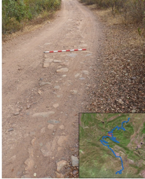
Figura 3. EVIDENCIAS EN SUPERFICIE DE LA CONDUCCIÓN LOCALIZADAS EN LA SIERRA DEL SALTILLO